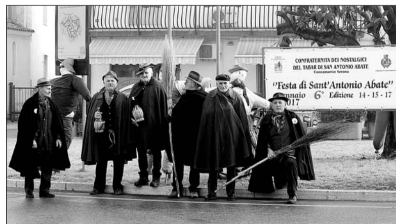
Un gruppo di “nostalgici” del tabàr di Sant’Antonio abate

Si è conclusa lo scorso 17 gennaio l'annuale festa organizzata dalla “Confraternita dei nostalgici del tabàr di S. Antonio abate” in collaborazione con l'Amministrazione comunale. La Confraternita, che è gemellata con l'Associazione Priori del piatto di S. Antonio abate di Assisi, durante i tre giorni di festa tra le varie iniziative messe in campo ha premiato il vincitore della II edizione del concorso “El meo fogazin”. Si è anche svolto il II raduno ippico S. Antonio abate, benedetto il sale, ma anche gli animali domestici e da cortile oltre allo svolgimento della tradizionale processione per le vie del paese con la statua del santo. La messa è stata celebrata da padre Franco Musocchi, ministro generale dei fratelli di S. Francesco ed è stata animata dal coro locale “S. Lorenzo” diretto dal maestro Gabriele