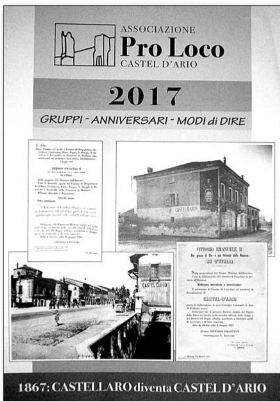
1867: CASTELLARO diventa CASTEL D'ARIO