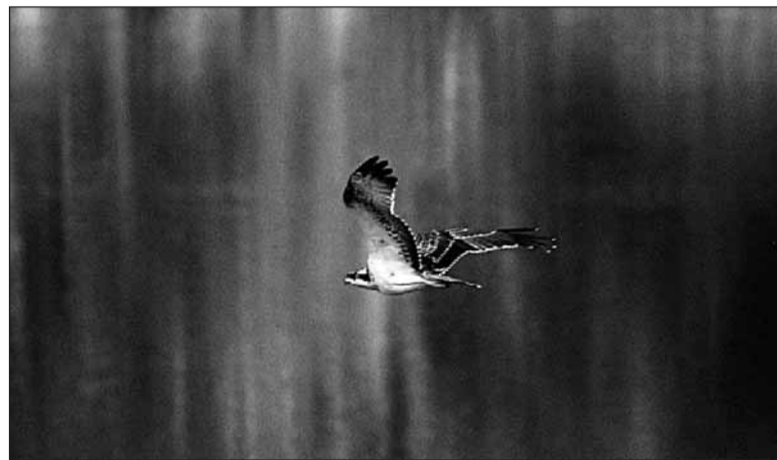
Il falco pescatore in una foto scattata da Andrea Mosele