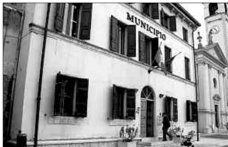
La sede municipale di Buttapietra

Sta succedendo la stessa cosa di quando, nei primi anni 2000, arrivavano ai comuni richieste di insediamento delle prime antenne per la telefonia mobile. La maggior parte delle amministrazioni accettava l'insediamento delle nuove strutture, anche perché accompagnate da finanziamenti. Si capì poi che il fenomeno andava governato, così nacquero i primi regolamenti, che collocavano le antenne fuori dai centri abitati. Si era capito che le onde elettromagnetiche esistono e che alcune fanno male al nostro corpo, ma ciò non impedì ad esempio che si diffondesse il sistema "Wi fi", presentato come conquista di "progresso", ma fonte di radiazioni dannose. Arriva ora la tecnologia 5G, come le precedenti accolta con enfasi, definita dai cantori della "modernità" l'ultima frontiera della comunicazione, mentre alcuni studiosi la ritengono pericolosa, oltre che di dubbia utilità. Bene ha fatto dunque il Consiglio comunale di Buttapietra ad affrontare il problema, svolgendo appieno il ruolo che spetta a un'assemblea elettiva. La delibera è strutturata in una premessa, che ricorda come "il 5G, nuovo standard di comunicazione mobile, favorirà nuovi servizi e lo sviluppo dell'industria 4.0, aumentando la comunicazione tra gli oggetti e tra oggetti e persone, la circolazione dei Big Data e il cosiddetto "internet delle cose" e afferma che "questa tecnologia interessa la libertà di