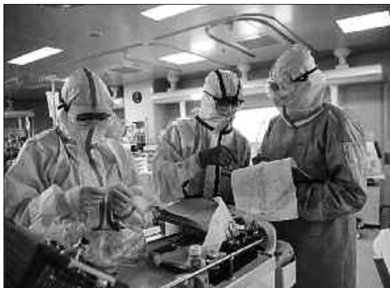
La foto simbolo del "Coronavirus": medici all'opera per tentare di risolvere questa pericolosissima emergenza sanitaria

la poliomielite del 1952 (3200 morti in USA), l'Asiatica del 1957 (2 milioni di morti), l'Influenza di Hong Kong del 1968/69 (1 milione di morti, 20.000 in Italia), la SARS (Sindrome respiratoria severa acuta) del 2002/2004 (880 morti, "martire" il medico italiano Carlo Urbani), l'Influenza aviaria del 2005 (379 morti), l'Influenza suina del 2009 (6.000 morti), l'Ebola in Africa dal 2007 al 2019 (7.700 morti).