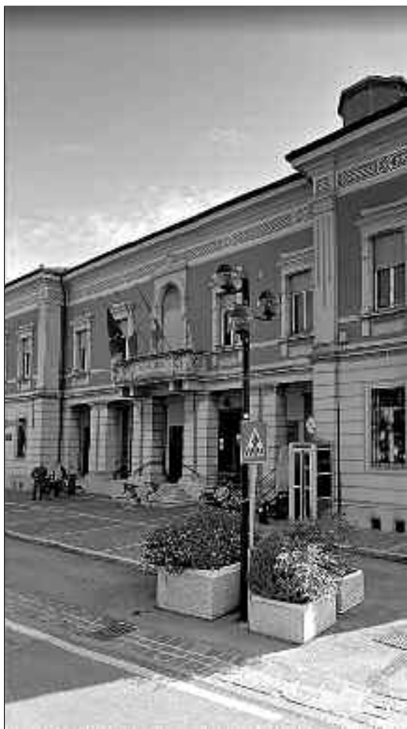
Il municipio di Castelbelforte