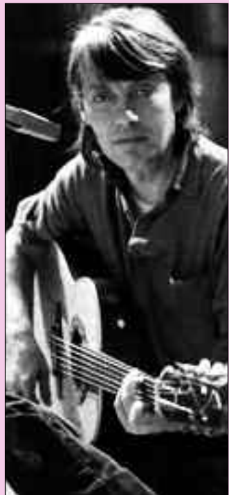
Fabrizio De André