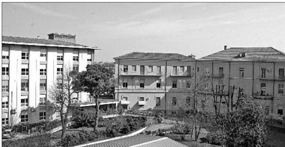
Il cortile interno dell'ospedale di Isola della Scala. Davanti il fabbricato storico e a sinistra quello nuovo

E intanto? Un'idea di come si sta lavorando in quello che era l'ospedale l'hanno data le osservazioni e perplessità avanzate dai cittadini alla fine dell'incontro pubblico sul nuovo piano organizzato recentemente dalla Cisl all'auditorium di Santa Maria Maddalena: si continua a tagliare servizi senza garantire alternative; da agosto le prenotazioni delle mammografie si dirottano verso altre strutture; si lavora per i privati, mandando gli ecodopler a Peschiera; il pronto soccorso