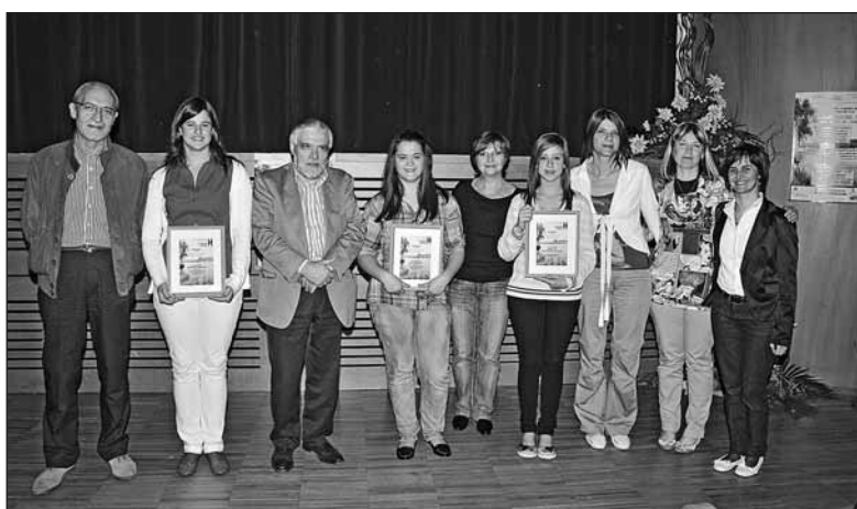
Studenti ed insegnanti del Progetto "Per una società che include" con i rappresentanti della Coop. "La Scintilla"