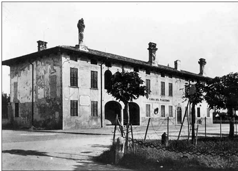
Palazzo Maggi in una foto degli anni '20 del secolo scorso

Nella prima parte della ricerca è stata ricostruita la vicenda della famiglia veronese dei Rizzoni, proprietaria di fondi in paese, che fece costruire il palazzo in questione sul finire del 1500. Quasi tre secoli dopo il palazzo passò a un'altra famiglia veronese, i Maggi, da cui prese il nome, prima dell'acquisizione del Comune avvenuta nel 1921. Da allora l'edificio, trasformato in "casa del fascismo", divenne il fulcro della vita sociale nogarese. Dopo un periodo di degrado, un restauro di qualche anno fa ha riportato l'e-