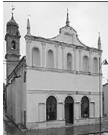
L'ex convento S. Maria delle Grazie