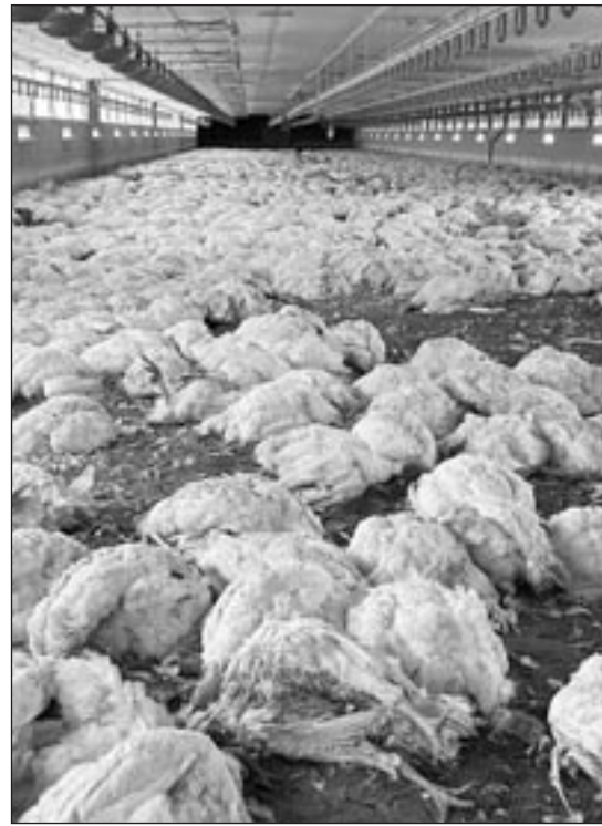
Strage di tacchini in un allevamento