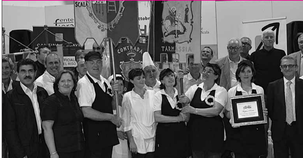
La contrada di Tarmassia vincitrice del XXVII concorso gastronomico "Palio del Risotto"