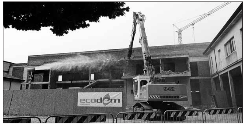
La ruspa al lavoro per la demolizione

Una volta eseguita la demolizione riprenderanno i lavori di ampliamento. In una dichiarazione i rap-