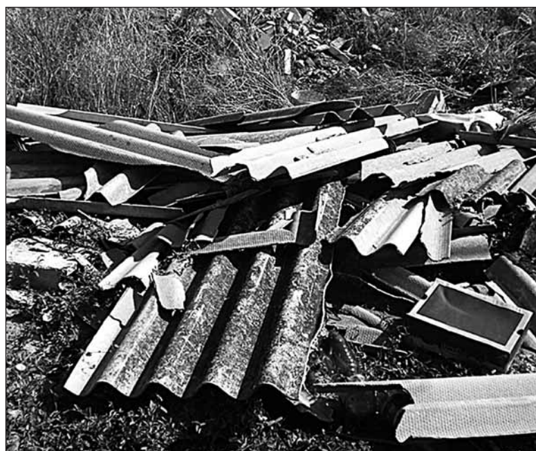
Lastre di amianto abbandonate nelle campagne