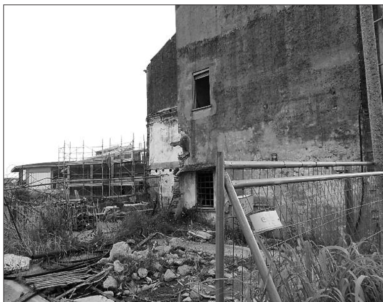
I ruderi del Mulino del Palasio a Isola della Scala

nate dalla struttura intatta del mulino, che aveva permesso alla famiglia Einstein di creare, nel 1900, un'officina elettrica per dare l'illuminazione pubblica al paese. La "Privilegiata Impresa Einstein per l'illuminazione elettrica", formata da Hermann e Rudolf Einstein, titolari di un'impresa di impianti elettrici, padre e zio di Albert, installò il primo impianto di illuminazione pubblica del paese utilizzando l'energia idraulica del mulino. I due fratelli lavorarono accompagnati da Albert, il futuro geniale creatore della teoria della relatività, allora ventenne. Il Comune stipulò l'11 aprile 1900 con l'impresa Einstein un accordo "per la concessione per impiantare un'officina per la produzione e distribuzione dell'energia elettrica a precipuo scopo di illuminazione pubblica". Il contratto era ventennale e il Comune versava 2.870 lire l'anno per 52 lampade. Due anni dopo Hermann morì e della concessione non si seppe più nulla. Del dicembre 1901 e dell'aprile 1902 sono le ricevute per la fornitu-