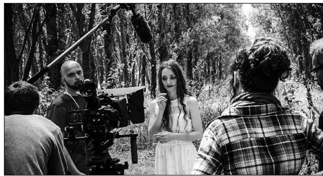
Sul set in un momento delle riprese del film

“Il cortometraggio – spiega il regista – sarà proposto a concorsi, anche internazionali, e in campagne di sensibilizzazione contro la violenza. Il progetto vuole essere il contributo di un gruppo di giovani artisti ad un problema che sempre più sta travolgendo la nostra società oltre che a promuovere fra i giovani del territorio Veronese l'attivi-