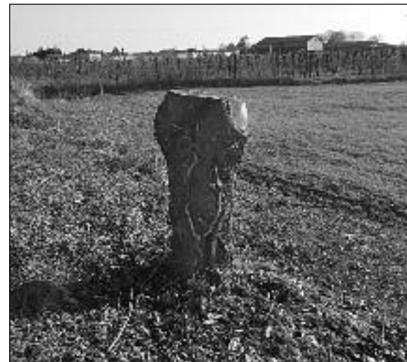
Capitozzatura, l'intervento più nocivo per l'albero