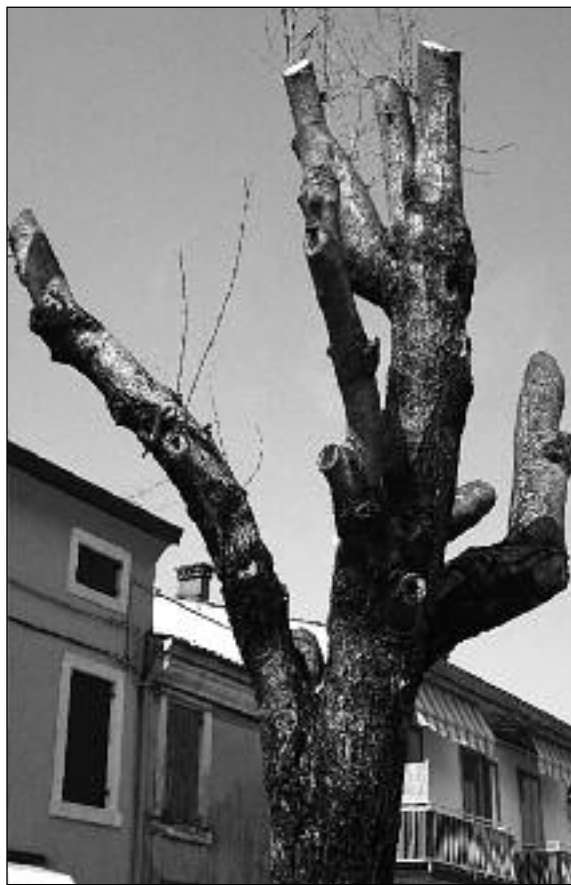
Raldon: la potatura eccessiva ha ucciso l'albero