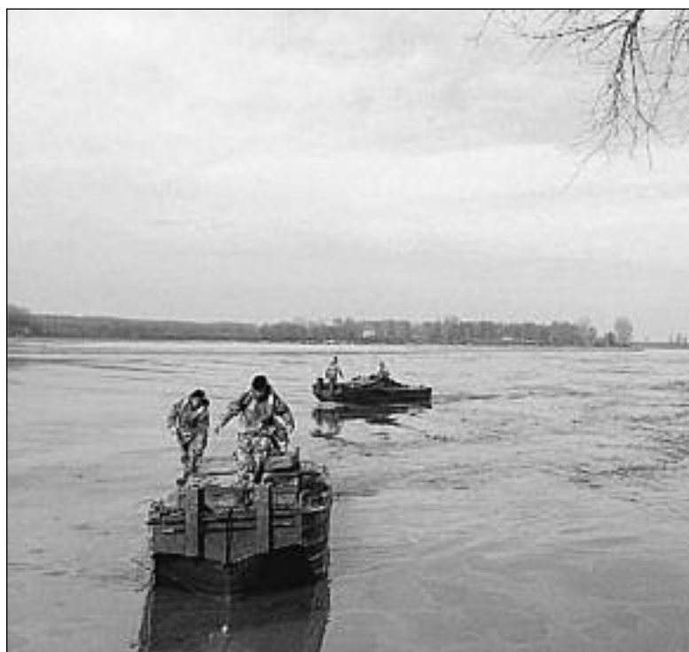
Sul fiume Po addetti al controllo delle acque