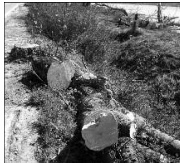
Alberi tagliati alla base a Erbè