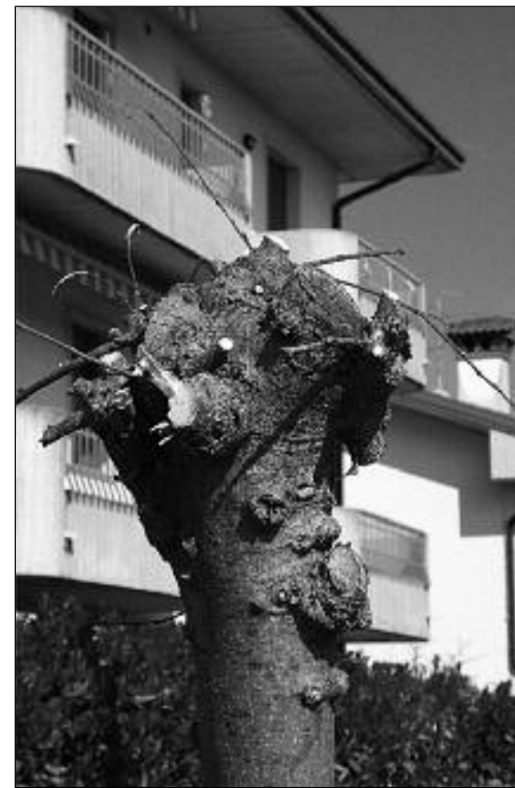
Povegliano: ciò che resta di un Perlaro

segue dalla prima pagina: L'inquinamento dei Pfas arriva fino al Po