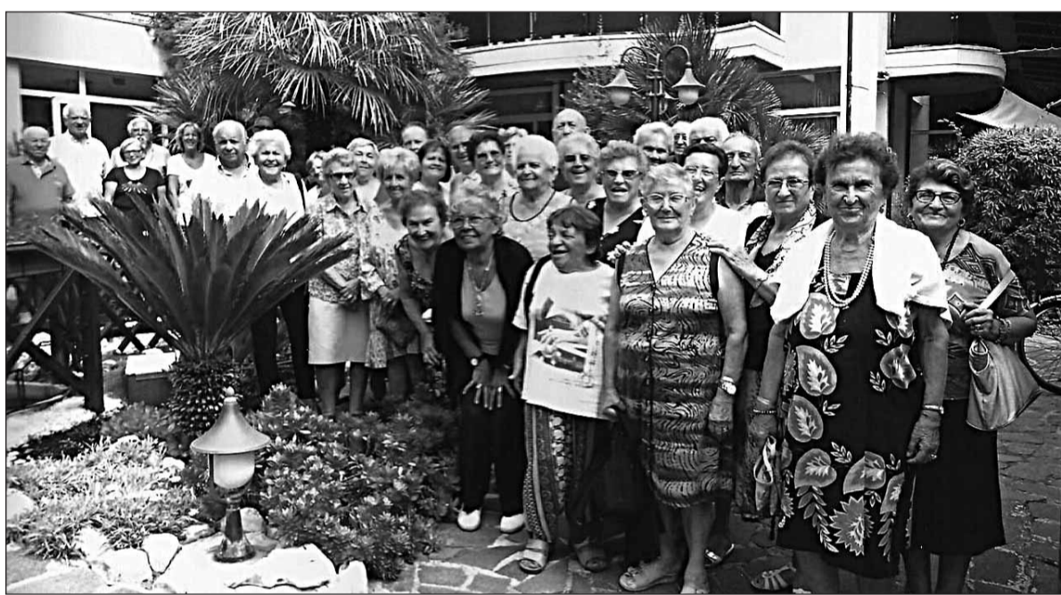
Felici e sorridenti i numerosi iscritti al Circolo Auser di Nogara immortalati davanti all'Hotel di Cattolica dove hanno trascorso un soggiorno marino dal 23 agosto al 6 settembre.