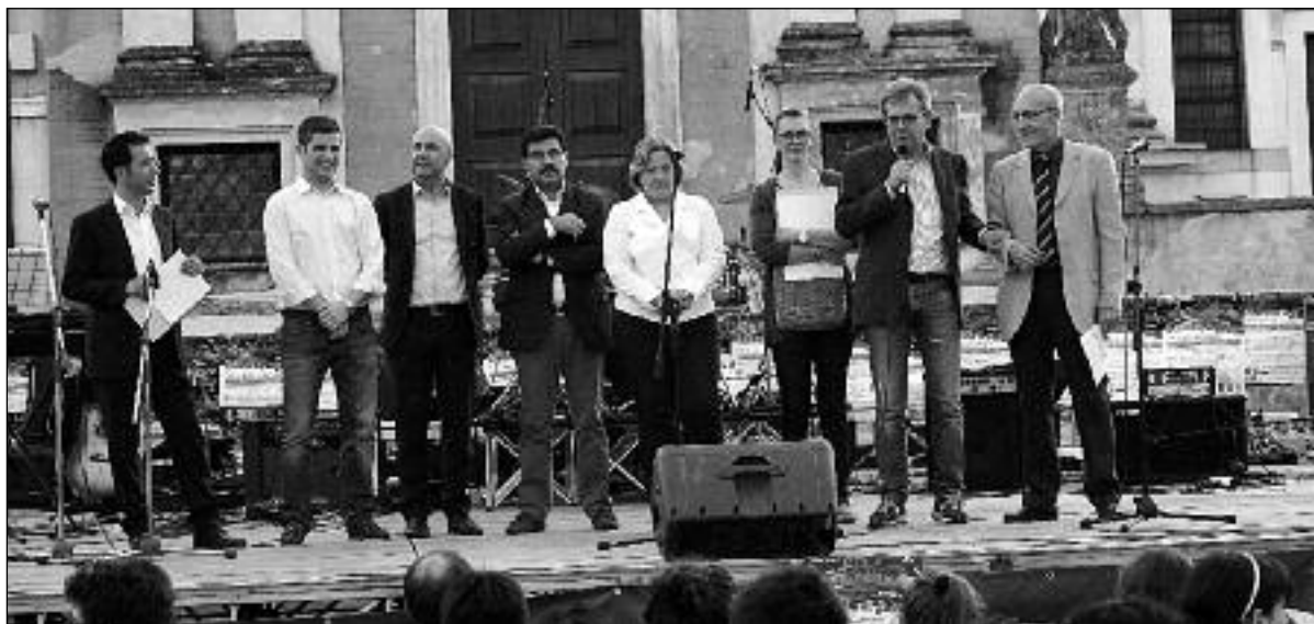
Le autorità sul palco allestito in piazza Martiri

Si è svolta con successo la manifestazione "Bolisani in piazza - La musica nel sangue", promossa dall'Istituto di istruzione superiore in collaborazione con l'Avis e ALL-IN Eventi col patrocinio dei comuni di Isola della Scala e Villafranca. La serata ha avuto tre momenti: il primo la premiazione dei migliori studenti dell'anno scolastico 2010-2011 (quelli con la media più alta dei vari indirizzi e classi), il secondo le canzoni che hanno partecipato alla rassegna regionale "La musica nel sangue" (il brano "Impressioni di Settembre" del gruppo Golden eyes si è classificato terzo nella finale regionale di Treviso), il terzo canzoni di vario genere proposte da studen-