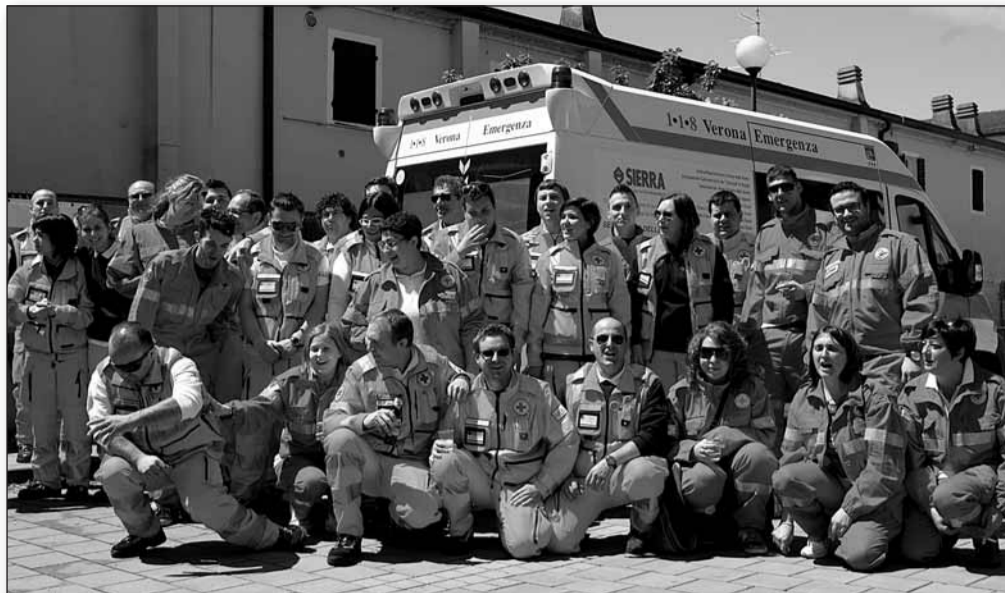
Il gruppo Croce Verde davanti alla sede di Isola della Scala