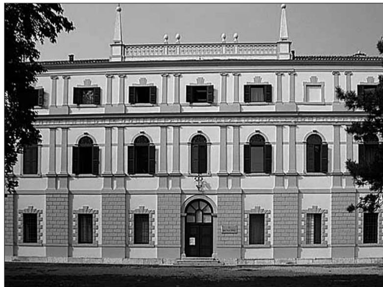
La sede municipale nel Palazzo Vescovile (sec. XII-XVII)