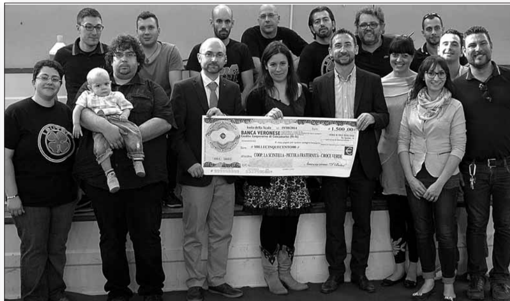
L'assegno devuluto alla Croce Verde dall'Associazione isolana "I Butei"