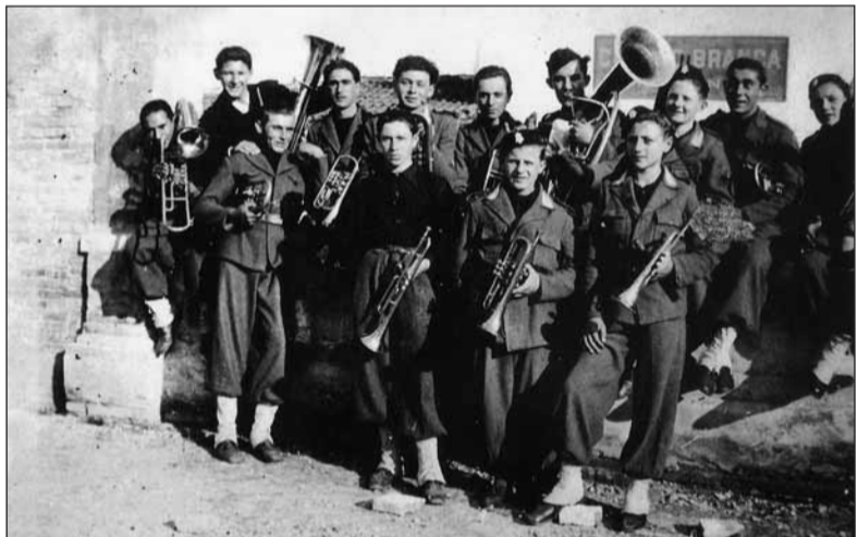
La fanfara isolana nel 1940