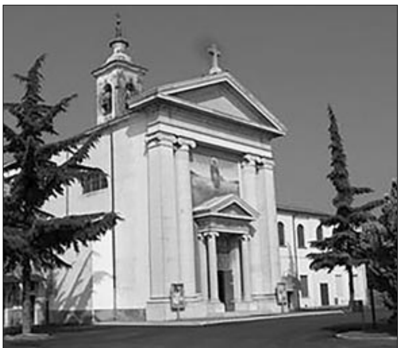
La chiesa parrocchiale di Santa Maria Maddalena