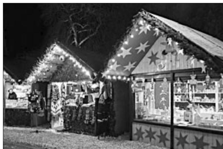
Un tipico mercatino di Natale

L'Amministrazione comunale in vista delle festività natalizie ha riunito tutte le associazioni del territorio per programmare, pur nella sobrietà, alcuni eventi. Si è deciso che i Mercatini tradizionali si terranno in Piazza IV Novembre domenica pomeriggio 4 dicembre dalle 14 in poi, con i gazebo delle varie associazioni (ospiti anche alcuni stand di Boscochiesanuova) e la Banda locale Le Penne Nere che allieterà il pomeriggio. Domenica 18 dicembre dalle 14 si svolgerà la "Corsa dei Babbi Natale" per le