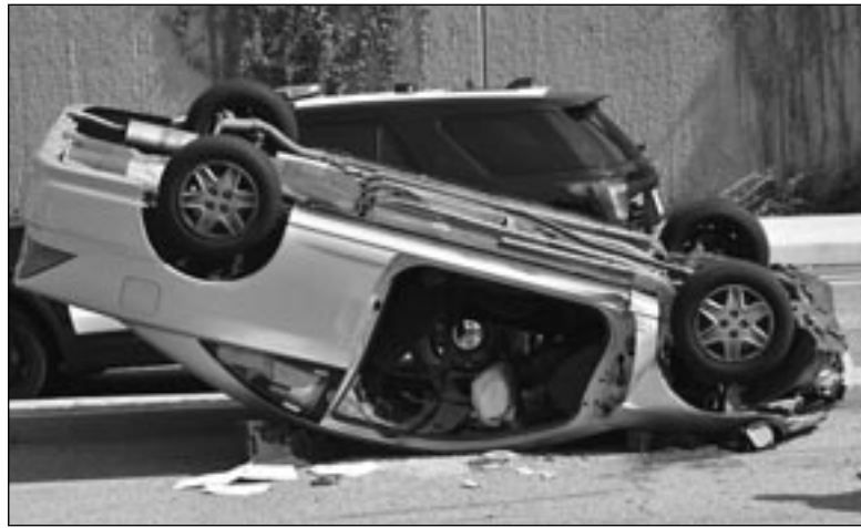
Uno dei tanti incidenti stradali la cui causa è la guida in stato d'ebbrezza

L'analisi sintetica e dura disegna un fenomeno impressionante, sul quale è difficile intervenire poiché certe abitudini sono effetto di cause