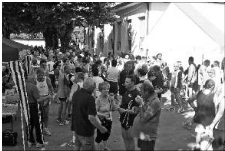
Un momento di relax dopo la "caminàda"